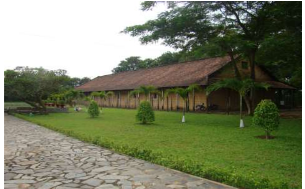
Phòng giam C – Khu di tích lịch sử nhà tù Phú Lợi

Nhà tù Phú Lợi là một chứng tích tố cáo tội ác của chiến tranh xâm lược.