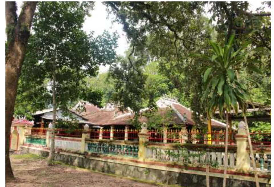
Ngôi đình thần Tân An (Bến Thố)

Ngôi đình được vua Tự Đức thứ 21(1869) ban sắc phong nhằm công nhận ngôi đình và phong tước hiệu cho thần Thành Hoàng để nhân dân thờ tự. Vị thần được thờ chính trong đình là Tiên quân cơ Nguyễn Văn Thành - một vị quan triều đình nhà Nguyễn. Về kiến trúc ngôi đình được làm toàn gỗ Sao, hình chữ Tam, có lối chạm trổ điêu khắc độc đáo, mang đậm phong cách kiến trúc nghệ thuật của một ngôi đình Nam Bộ xưa, đến nay còn bảo lưu nếp sinh hoạt văn hóa tín ngưỡng dân gian và các nghi thức thờ cúng truyền thống của đình làng Việt Nam.