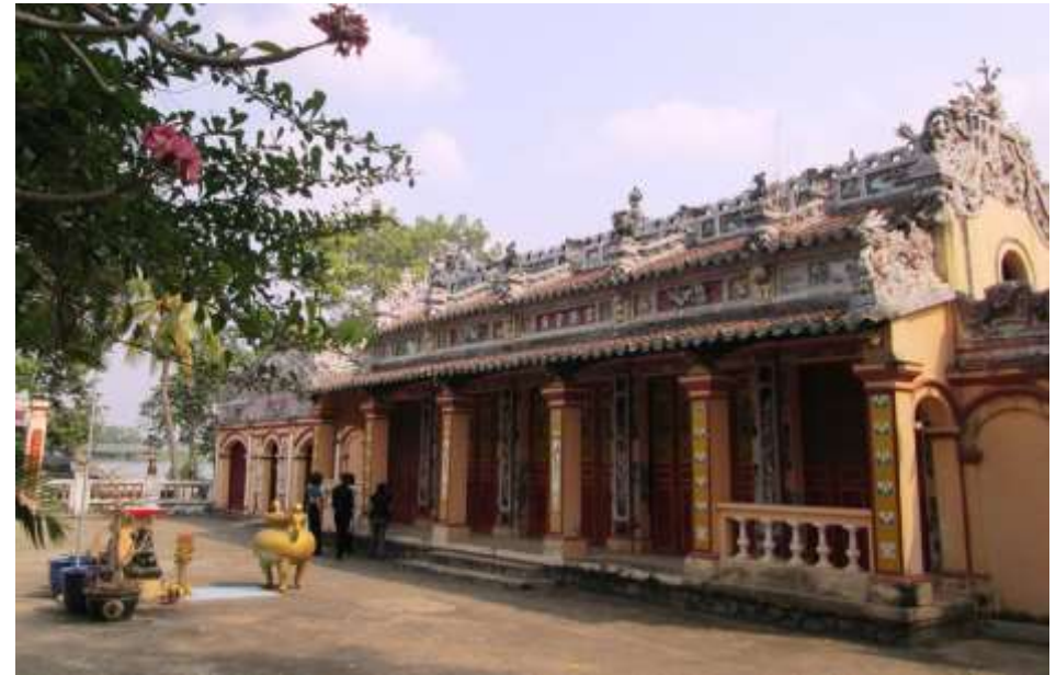
Ngôi Đình thần Phú Long

Với phong cách trang trí mỹ thuật thể hiện qua loại hình tranh ghép gốm mang đậm nét truyền thống văn hoá dân gian. Trong hai thời kỳ kháng chiến, đình là cơ sở hoạt động cách mạng của địa phương.