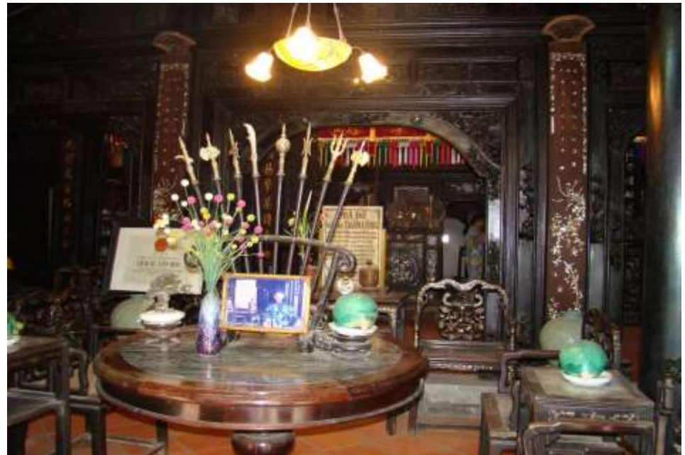
Gian chánh điện - Ngôi nhà cổ Trần Công Vàng

Ngôi nhà có giá trị rất lớn về mặt kiến trúc – nghệ thuật chạm trổ, điêu khắc gỗ truyền thống nổi tiếng của Bình Dương. Ngoài ra, hình thức trang trí còn thể hiện sự đề cao việc thờ cúng tổ tiên, mang đậm triết lý Nho giáo thể hiện tinh thần đạo đức, lễ nghĩa truyền thống của dân tộc. Ngôi nhà vừa mang tính nghệ thuật – nhân văn đậm nét văn hóa truyền thống Việt Nam, thể hiện sự phát triển về đời sống của cư dân người Việt trên đất Bình Dương.