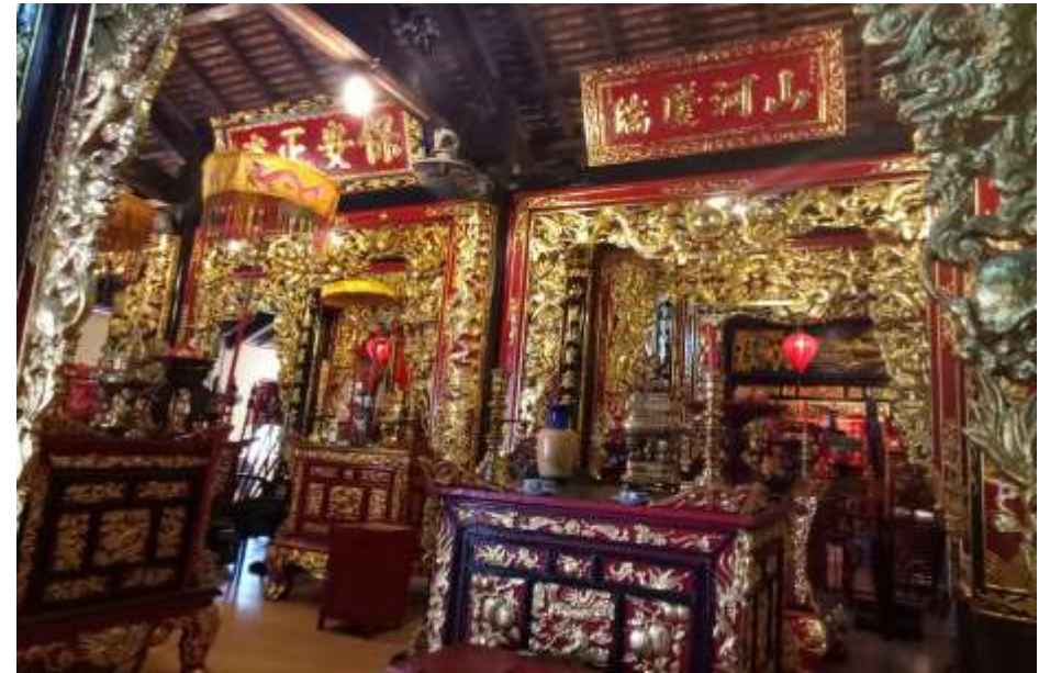
Danh thắng Núi Châu Thới