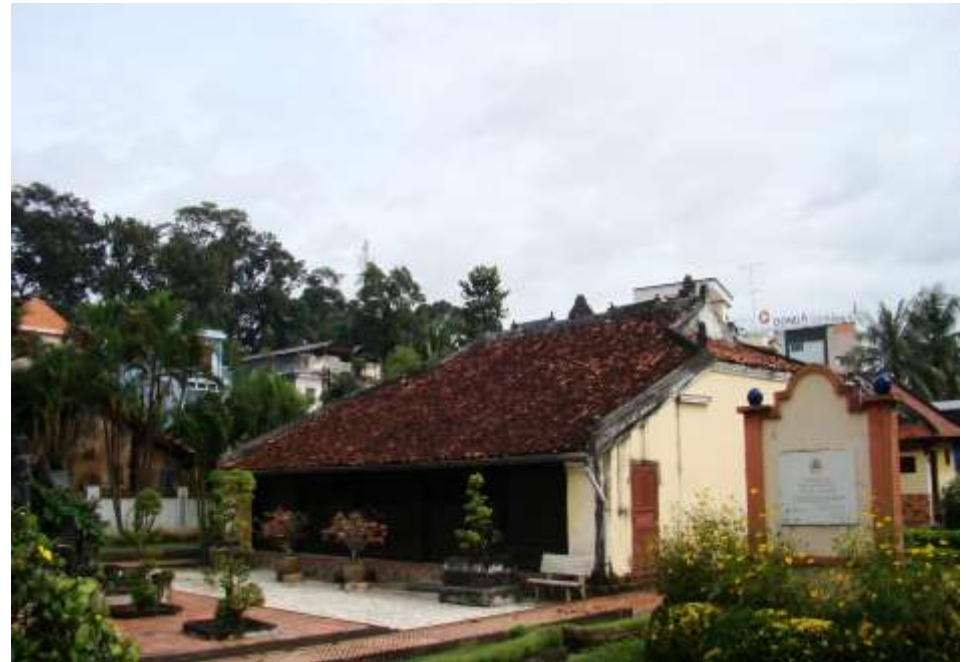
Ngôi nhà cổ Trần Văn Hổ

Ngôi nhà vừa mang tính nghệ thuật – nhân văn đậm nét văn hóa truyền thống Việt Nam, vừa thể hiện sự phát triển về đời sống của cư dân người Việt trên đất Bình Dương.