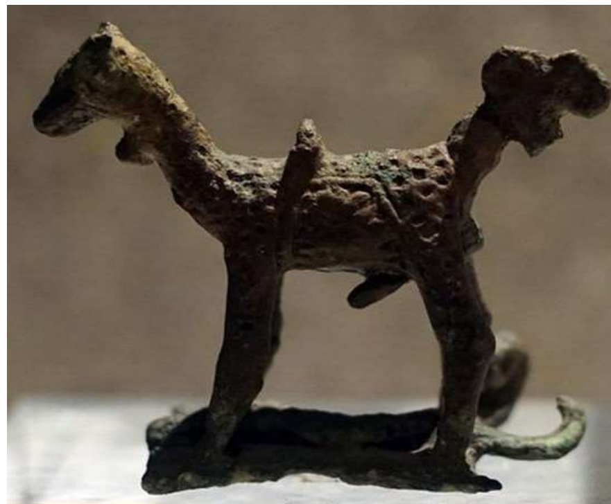
Bảo vật Quốc gia “Tượng thú”